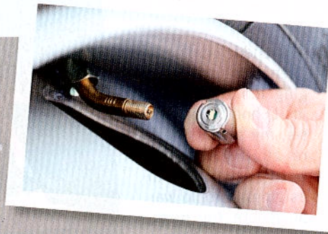
Der Mini-Sensor lässt sich unkompliziert am Radventil anbringen.

drucksensor sei bis zu 13,7 bar einsetzbar und für 18,50 Euro pro Stück unter www.lifetime24.com oder per Faxbestellung unter +49 (0) 89 89 74 67 41 erhältlich.